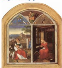
Твоє золотисте волосся Маргарита твоє полеласте волосся Суламіф ?

Проблема рівноцінності двох великих культур окреслюється у вірші місткого паралелю, в якій водночас порівнюються й протиставляються образи Маргарити й Суламіф – двох уособлень жіночого кохання, двох натхнених поетичних створінь німецького та єврейського духу, отже, двох символів відповідних національних культур.