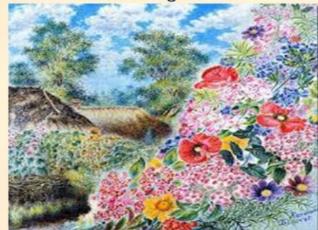
House in Bogdanovka